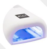
Lampada UV o LED 36 W o superiore