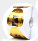
Cartine per ricostruzione