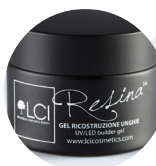
GEL MONOFASICO LCI RESINA