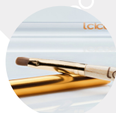
Pennello piatto per ricostruzione